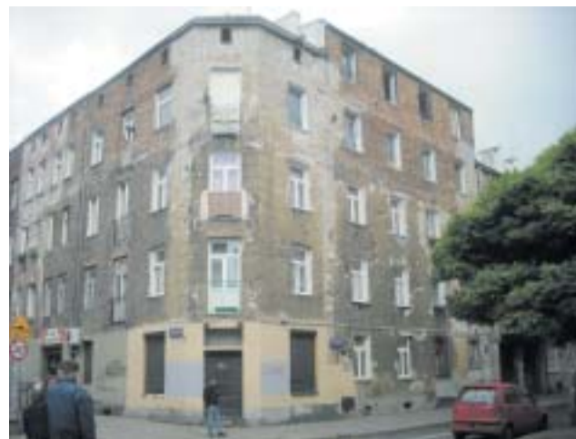
Kamienica przy ul. Zachariasza 1, w której Zbigniew Romaszewski mieszkał w latach 1945-1960, stan obecny.

Był rok 1956. Nastąpił październik, a jesienią